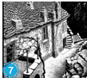
Maurits Cornelis ESCHER (1898 - 1972)