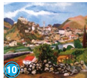
Suzanne VALADON (1865 - 1938)