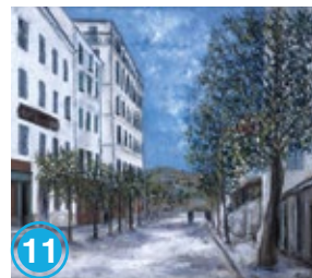
Maurice UTRILLO (1883 - 1955)