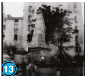
Roland BONAPARTE (1858 - 1924)