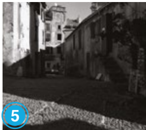
Raymond DEPARDON (né en 1942)