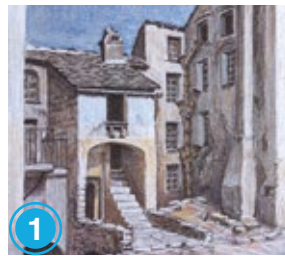
Maurits Cornelis ESCHER (1898 - 1972)