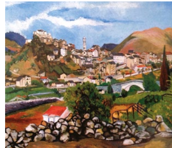
Suzanne VALADON « vue de Corte » (1913)

Parce que la Corse demeure une Terre de partages, de passions et d'inspirations, nous vous livrons au travers de ce parcours émotionnel une partie des richesses de notre ville.