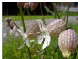
I Cioculi Le silène enflé