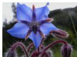
A frigia La bourache