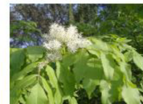
L'Ornu Le frêne à fleurs

Après la grande crue dévastatrice de 1947 et l'exode rural, les berges de la vallée de Luri, autrefois cultivées, connaissent un abandon de 60 ans, enfouies sous plus de 8 m de broussaille. C'est dans le cadre de la prévention des incendies et des crues, que l'Association réhabilite ces espaces agricoles, mettant en valeur un patrimoine végétal d'une grande diversité. Les propriétaires ont mis 12 ha de terres à notre disposition pour vous offrir ce parcours. L' arboretum bilingue offre la possibilité d'OBSERVER, de CONNAITRE et de COMPARER les différentes espèces. A vocation culturelle, il favorise la transmission des savoirs populaires.