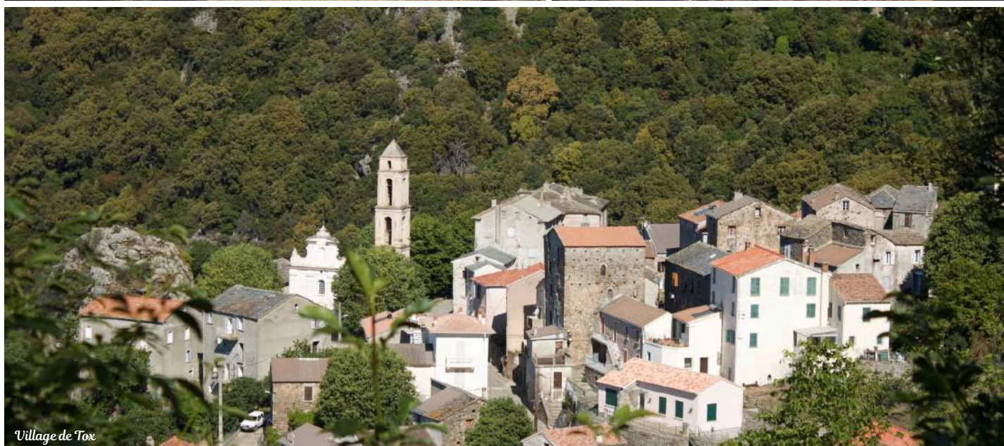
Village de Tox