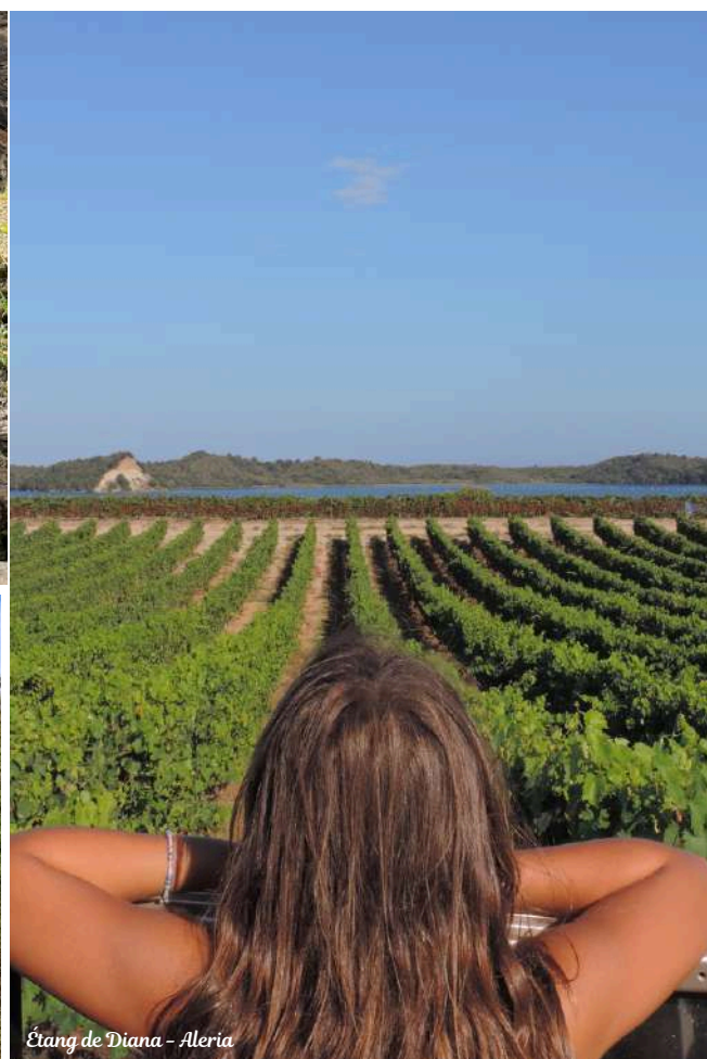
Étang de Diana - Aleria