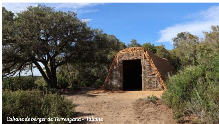
Cabane de berger de Terrenzana - Tallone